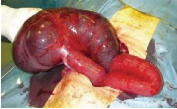
Resim 4. Detorsiyone edilmiş Çekal Volvulus.

dekompresyonu sağlanır. Çekostomi düşük rekürrens oranına sahiptir fakat çekostomi ile karşılaştırıldığında morbidite ve mortalitesi daha yüksektir. 12 Bu prosedür genellikle barsak canlılığı olan ancak yüksek riskli ve stabil olmayan hastalar için uygulanmalıdır. Rabinovici ve ark.'nın yaptığı bir çalışmada detorsiyon ve çekoeksi uygulanan hastalarda komplikasyon, mortalite ve rekürrens sırasıyla %15, %10 ve %13 olduğu, çekostomi sonrasında ise komplikasyonların %52, mortalitenin %22 ve rekürrens %14 olduğu rapor edilmiştir. 20 Çekoeksi ve çekostominin çekal duvarın sağlam ve normal kalınlığa sahip olduğu olduğu vakalarda fiksasyonun güvenilir olması açısından yapılması önerilmektedir ve barsak temizliği yapılması gerekliliği yoktur. 12 Literatürde sağ kolektomi ve primer anastomoz veya distal müköz fistül ile birlikte ileostomi tercih edilen cerrahi tekniktir. 21 Rezeksiyon yapılan vakalarda rekürrens bildirilmemiştir, morbidite ve mortalitesi düşüktür. 12 Çıkan kolonun rezeksiyonu volvulus rekürrensi olasılığını ortadan kaldırmakla birlikte, kolektomi daha uzun ameliyat süresine ve