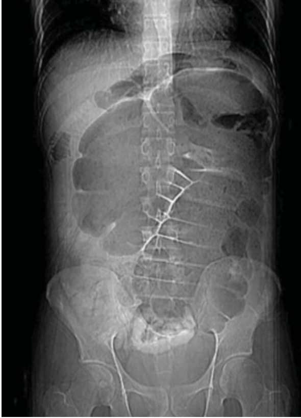
Resim 2. Çekal volvulus Ayakta Direkt Batın Grafisi.

uzun zamana ihtiyaç duyulması ve riskli hastalarda perforasyon ve barsakta gangrenöz değişikliklere neden olabilmesi nedeniyle önerilmemektedir. 12