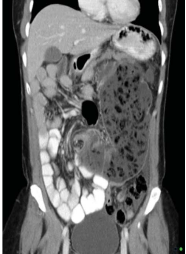
Resim 3. Çekal Volvulus BT görüntüsü.

Çekal volvulusun optimal tedavisi intestinal obstruksiyonu düzeltmek için yapılan cerrahi tedavidir. Rotasyona uğramış olan segmentin acil olarak cerrahi redüksiyonu ile morbidite ve mortaliteyi arttıran nekroza progresyonun önlenmesi sağlanır (Resim-4). Çekal volvulusun tedavisinde kullanılabilen cerrahi